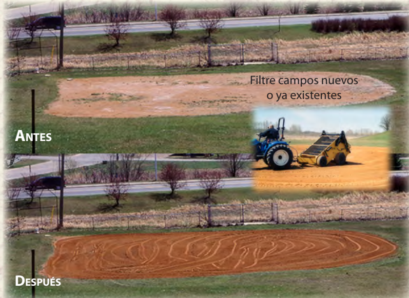
Filtre campos nuevos o ya existentes