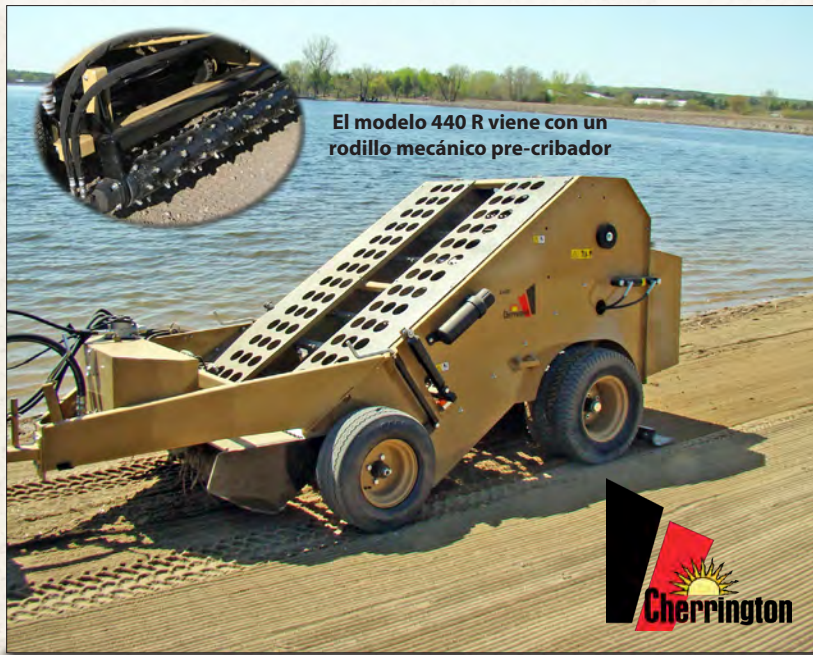
El modelo 440 R viene con un rodillo mecánico pre-cribador